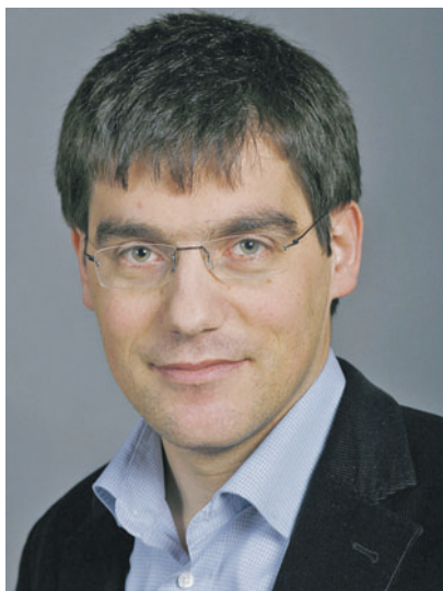
Nationalrat Roger Nordmann, SAL Schaan, 4. Juni, 19 Uhr.

CO 2 -Ausstoss so verringern, dass Liechtenstein die Klimaziele erreicht? Roger Nordmann zeigt den Weg in eine klimaneutrale Zukunft auf. Er präsentiert einen Solarplan für die Zukunft und diskutiert mit dem Publikum. Covidbedingt bitten die Veranstalter dringend um Anmeldung: info@solargenossenschaft.li.